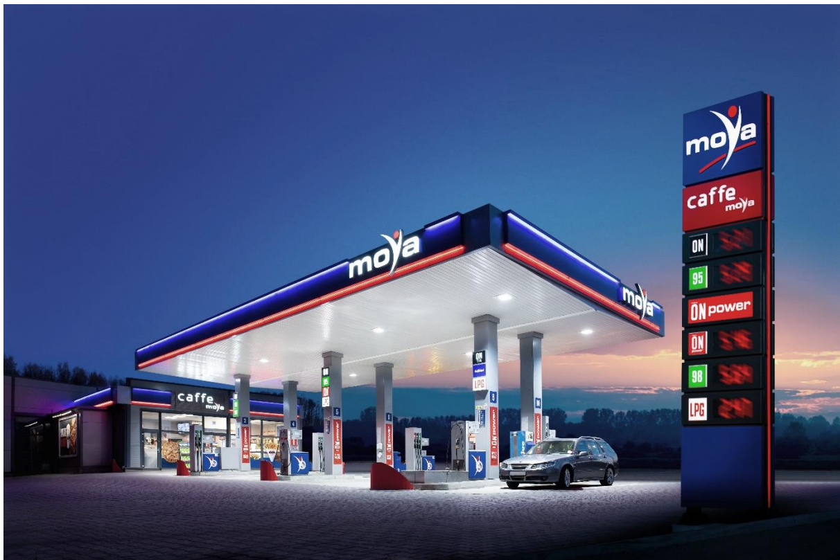
Warszawa, 28 marca 2024 r.